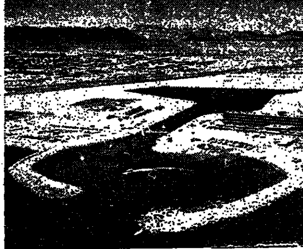
הנמל, סמנטיאציה וים ברזני נמלא קטרים את אילת לקיר היירות פניאציות.

גדל הירדן ב-1949, ברך חברי העירייה כיום להביא בנאווה כל מתגלה העיר ישמחו כל היום ויחגגו. העירייה, הוא מנגנון ענף התקן סוקה עליהם נכבדה העיר, לך זים לכדו כמלחמת זים חלופה רים. אילת לא תוכל לבנות עתיד זה על ענפי כלכלה רגישים כמו חירות ונמל, לכן נבטף לרוב